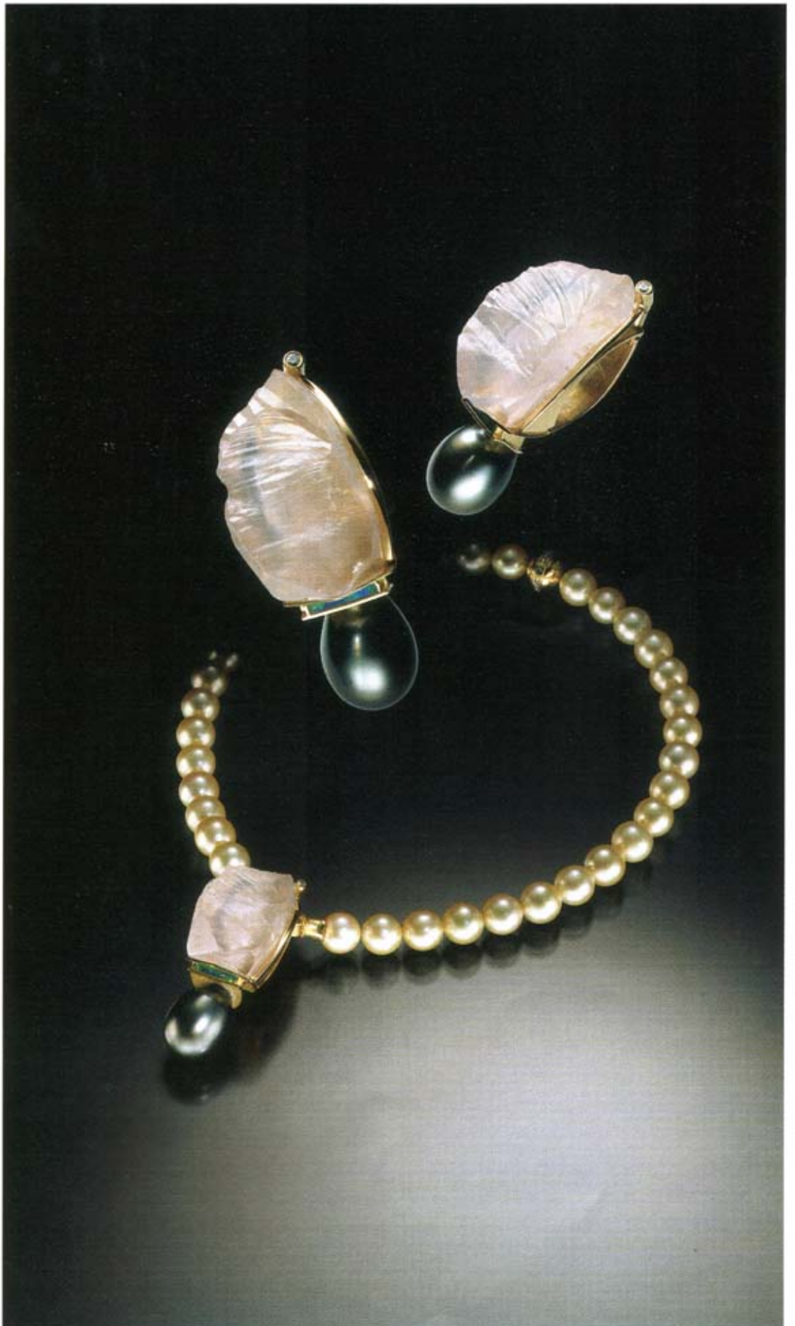
Rosaquarzanhänger mit schwarzem Tahitiperlentropfen 750 Gold, Brillant, Opalinlay. Champagnerfarbene Südseeperlenkette.